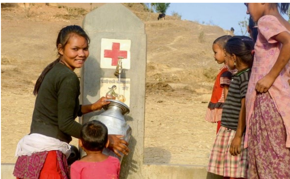
Junge Frau holt Wasser beim Brunnen in Diwang (Region Salyan), der mit Unterstützung des SRK gebaut wurde.

Viele Menschen im In- und Ausland leben in Not. Ihnen hilft das Schweizerische Rote Kreuz mit seinen verschiedenen Organisationen – vom Samariterbund bis zur Rettungsflugwacht, von der Lebensrettungs-Gesellschaft bis zum Blutspendedienst.